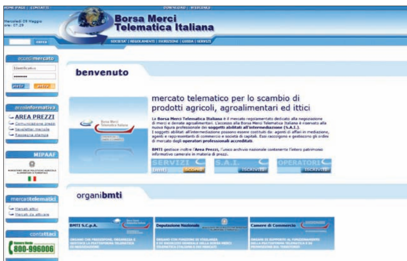
La home page del sito www.bmti.it .

“Con la Borsa Merci Telematica Italiana - il cui via libera definitivo è stato dato il 7 marzo scorso a Roma alla presenza del Ministro delle Politiche Agricole Paolo De Castro - si mira ad avere un sistema-mercato fondato su basi regolamentari certe e univoche,